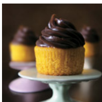
Só quero chocolate